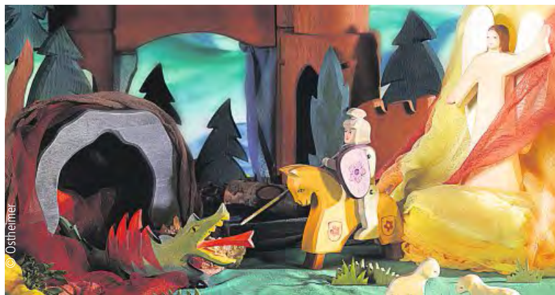
Fantastische Spielwelten Spiele aus Holz - hier von Ostheimer

Seit der Erfindung der Bauklötze durch den Pädagogen Friedrich Fröbel ist Holzspielzeug aus keinem Kinderzimmer mehr wegzudenken. Fröbel erkannte, dass einfache Holzbauklötze die Kreativität bei Kindern besonders fördern, weil sich daraus immer wieder etwas Neues bauen lässt. Neben den klassischen Bauklötzen, die viele Holzspielwarenhersteller anbieten,