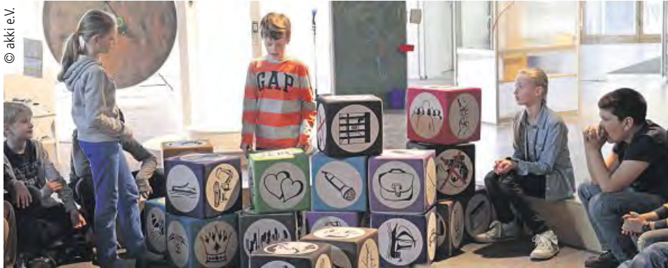
Mit dem Geschichtenwürfel werden aus den erwürfelten Symbolen Geschichten erfunden.