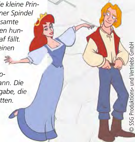
© SSC Produktions- und Vertriebs GmbH

1., 2., 8., 9., 15., 16. Dezember um 16 Uhr