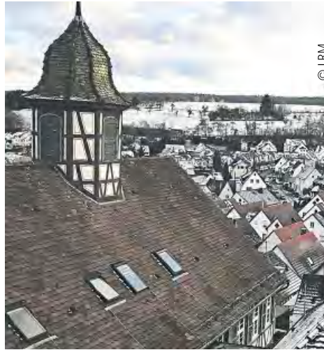
Blick vom Museum über Waldenbuch

Als Leitfaden bekommen wir an der Kasse ein Entdeckerheft mit spannenden Fragen, die wir bei unserem Rundgang beantworten sollen. (Unter allen Teilnehmern werden im Februar 2019 drei Preise verlost.) In fast jedem Raum werden wir fündig und bewundern die kunstvollen Krippen aus verschiedenen Jahrhunderten und Materialien. Wir erfahren, dass es Krippen seit etwa 1500 gibt und dass sie immer wieder die Geburtsszene in den Kontext ihrer Entstehungszeit verlegt haben. Besonders eindrucksvoll ist die Tiroler Weihnachtskrippe im Glaskasten, die vor mehr als 200 Jahren von Holzbildhauern der Familie Probst geschaffen wurde. Die Ulmer Krippe gibt einen Einblick in das Ulmer Stadtleben des frühen