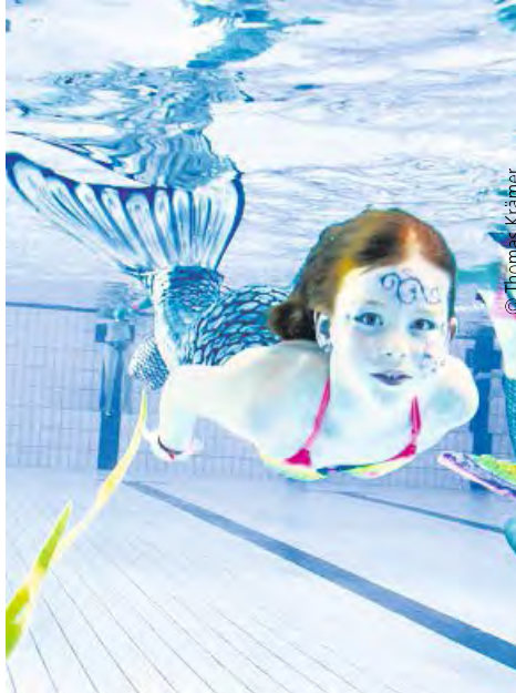
Halb Fisch, halb Mensch

Sowohl Jungen als auch Mädchen werden in schillernde Unterwasserwesen mit Schwanzflosse verwandelt und lernen, wie man mit Monoflosse richtig schwimmt und taucht. Die nächsten Termine sind am Samstag, dem 1. Dezember, Samstag, dem 5. Januar und am Samstag, dem 2. Februar. Geschwommen wird in verschiedenen Gruppen ab 10 Uhr. Mehr Informationen hierzu sowie zu weiteren Geschenkideen für Erwachsene wie die beliebten Fildorado-Wertkarten „Geschenke für alle Sinne“ wie die Wellness-Tage „Balance“ und „Atempause“ oder Geschenkgutscheine zu jedem Anlass gibt es unter www.fildorado.de .