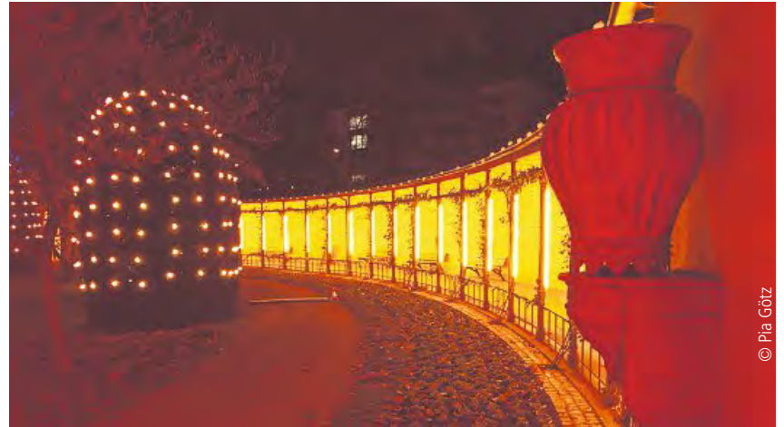
Die Arkaden in weihnachtlichem Glanz

An manchen Tagen herrscht auf den Weihnachtsmärkten ein großes Gedränge. Seit 15. November gibt es eine Alternative, um sich auf die Adventszeit einzustimmen – den Christmas Garden in der Stuttgarter Wilhelma. „Die Lichter und die damit verbundene Atmosphäre passen perfekt in die Gartenanlagen der Wilhelma“, erklärt Christian