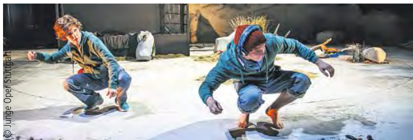
In der neuen Spielzeit auch wieder im Programm der Jungen Oper: Gold

S-Nord (sr) - Am 1. Dezember beginnt bei der Jungen Oper Stuttgart mit dem Umzug vom Kammertheater in die neue Spielstätte JOiN (Junge Oper im Nord) eine neue Ära mit noch mehr künstlerischen Möglichkeiten.