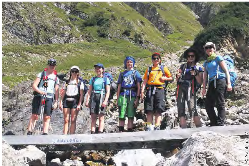
Mit Familie und Freunden zu Fuß über die Alpen