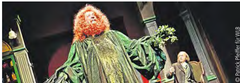
Der „Geist der gegenwärtigen Weihnacht“ erscheint Ebenezer Scrooge