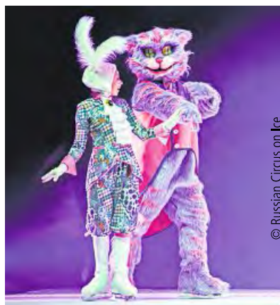
Weiße Kaninchen und Grinsekatze und entführt kleine und große Zuschauer in ein magisches Zauberreich.

Die neue Produktion von Lewis Carrolls Klassiker ist vom Russian Circus on Ice als schwungvolles Eisballett in Kombination mit russischer Zirkuskunst inszeniert