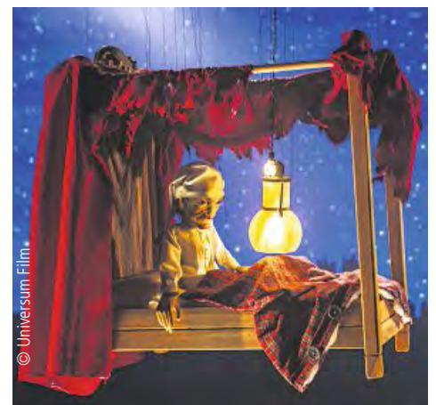
Ebenezer Scrooge fliegt in seinem Bett durch die Nacht.