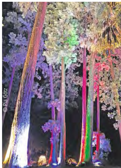
Auch die Mammutbäume sind Teil der Lichtinszenierung.