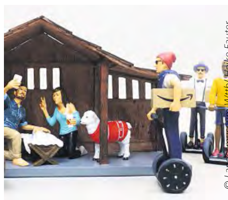
Bei den Krippen finden sich traditionelle Motive ebenso wie eine Hipster-Krippe mit Selfie und Segways.