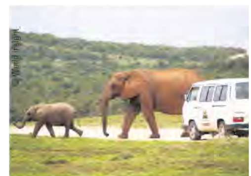
Spannende Begegnungen mit wilden Tieren

Neben den Aha-Momenten, die einem die afrikanische Tierwelt beschert, ist auch jede Menge