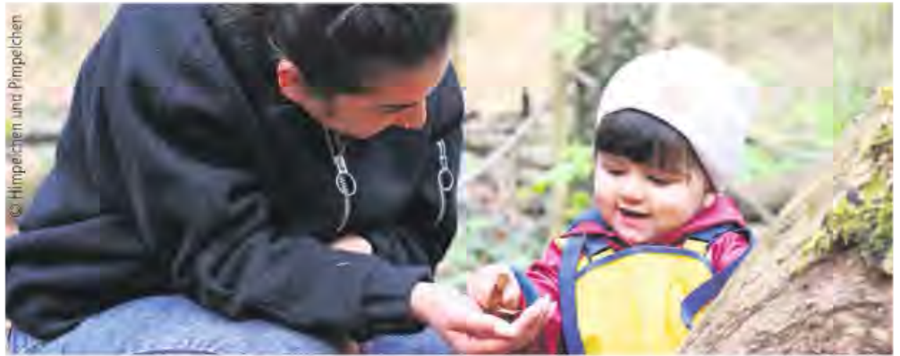
Naturerfahrung mit Erzieherin

„Himpelchen und Pimpelchen“ mit neuen Standorten