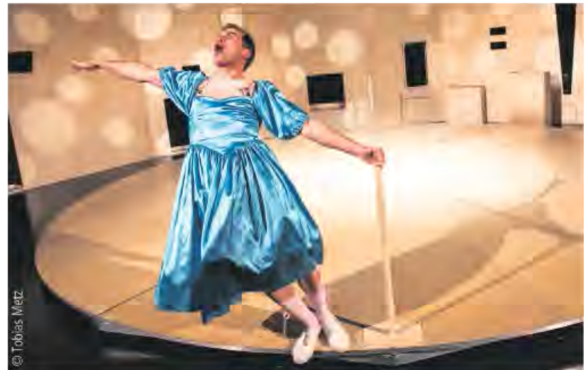
Wie sollte ein Junge sein?