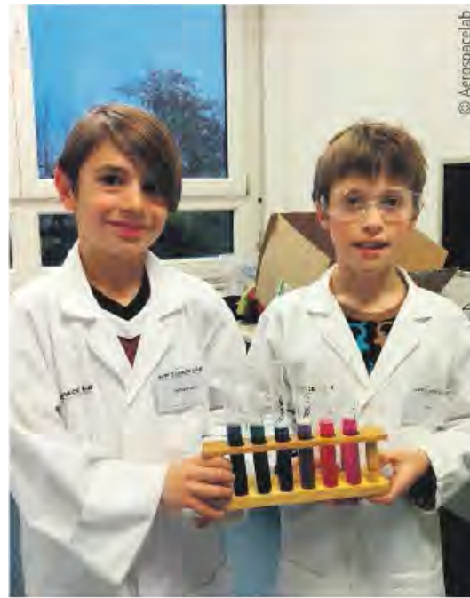
Chemie kann Spaß machen.

Wenn die Frage „warum“ auftaucht, kommen Eltern besonders bei technischen und naturwissenschaftlichen Fragen schon mal ins Stottern. „Wie entsteht ein