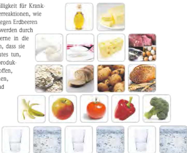
Ernährungspyramide des Gesundheitsamtes Stuttgart

Maultaschen mit Ei oder Melone zum Frühstück“. Auf seinen Reisen habe er gesehen, dass es in Brasilien Obst zum Tagesbeginn gibt, in Amerika Eier mit Würstchen und in China Suppe. Seine Erfahrung ist, dass Kinder vor allem bei kohlenhydratreichen Produkten wie Nudeln und Kartoffeln zugreifen, denn sie brauchen viel Energie. Er plädiert für die mediterrane Küche mit viel Grünem, wenig Wurst und ohne industriell verarbeitete Lebensmittel: „Wer seinen Kindern natürliche Produkte ohne Zucker, Süßstoff, Geschmacksverstärker, Aromen und Konservierungsstoffe gibt, kann eigentlich nichts falsch machen. Die Kinder wählen dann das aus, was sie brauchen. Der Erfolg sind, wie schon bei Clara Davis, lachende, aktive und glückliche Kinder.“