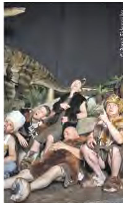
König Gugubos Geburtstagsfest will sich keiner entgehen lassen.

Wenn der schusselige König Gugubo alle seine Freunde zum fröhlichen Geburtstagsfest lädt, dann ist die ganze Steinzeit aus dem Häuschen. Die wildesten Stämme, Urzeitwesen, Ungetüme, Jäger und Sammler machen sich auf ins Steinfelsental. Die Festgäste kommen natürlich nicht mit leeren Händen: der singende Meisterkoch serviert einen herrlich ekelhaften Schlabbersalat, die Knörfe sorgen für ein warmes Lagerfeuer, der Worte-Erfinder Wotz für festliche Worte und die Gugus fürs Tanzvergnügen. Auch der gemütliche Riese Matze, die Nörgelfürsten Grimmich und Meck Miesepit sind mit dabei.