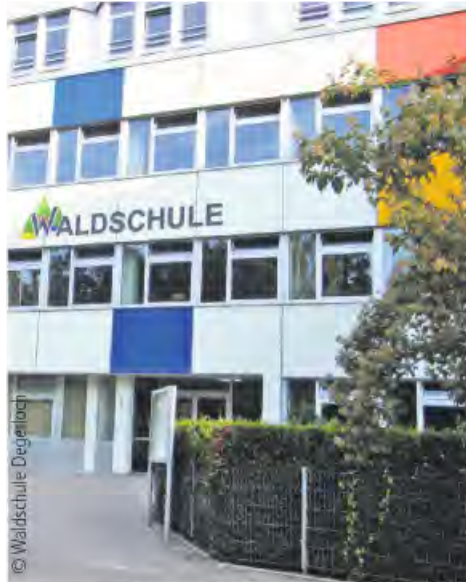
Die Waldschule in Degerloch