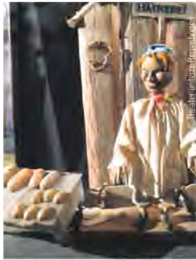
Sinnliches Theater: Brezel Brezel