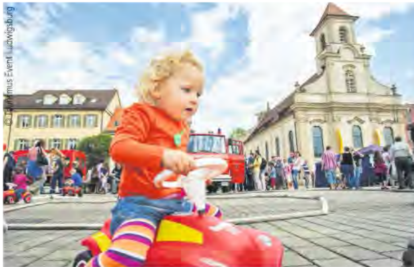
Kinderfest vor barocker Kulisse

Alle Infos www.ludwigsburg.de/Ldel/start/kultur-freizeit/stadtjubilaeum.html