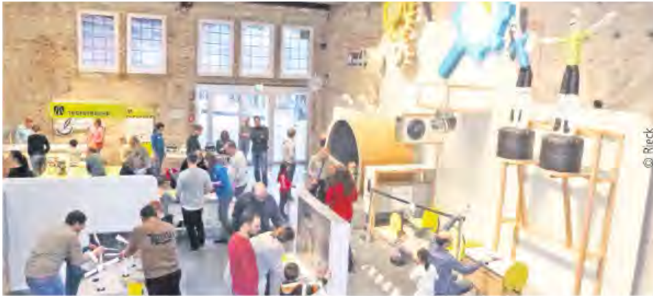
Ein Raum voller Experimente

Ableger der Experimenta Heilbronn in Schorndorf eröffnet