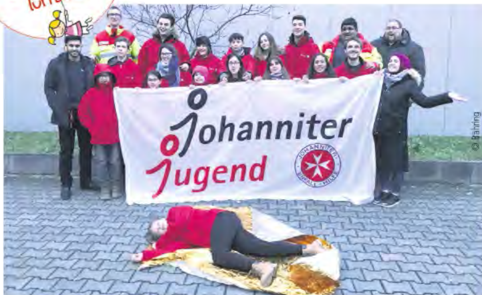
Gut vorbereitet für den Ernstfall - die Gruppe in Zuffenhausen