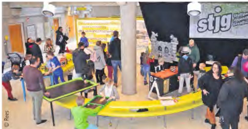
Spiel und Spaß am Stand der Stuttgarter Jugendhausgesellschaft

die Messe mittlerweile wichtiger Ideengeber und damit eine unschätzbare Hilfe, um die vielen Ferienwochen der Kinder, in denen die Eltern arbeiten müssen, zu überbrücken. Eine Mutter berichtete: „Auf der FeriencampMesse plane ich mittlerweile die gesamte Ferienzeit der Kinder, bis auf die Wochen, in denen wir etwas gemeinsam unternehmen können.“