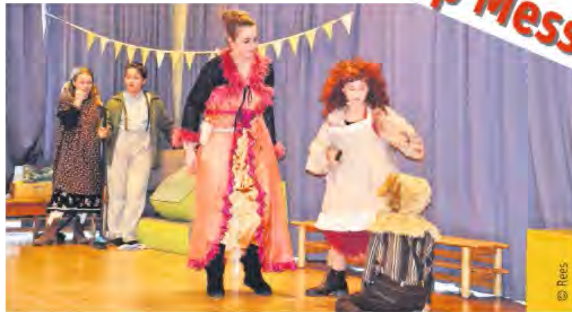
Die Junge Akademie zeigte auf der Showbühne Ausschnitte aus ihrem Musical „Annie“.

Für viele Besucher und Besucherinnen ist