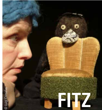
Georg in der Garage

FITZ Theater animierter Formen Eberhardstr. 61, 70173 Stuttgart, 0711-24 1541 info@fitz-stuttgart.de www.fitz-stuttgart.de